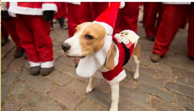
Skrējienā aicināti piedalīties arī suņu īpašnieki ar savu draugu.